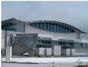
花巻市総合体育館

地域の特性や環境、そして多種多様な目的に応じた 柔軟で夢のある教育・文化施設作りを提案いたします。