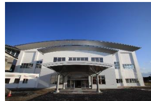
花巻市総合体育館増築 2011年11月完成 鉄筋コンクリート造 (一部鉄骨造) 延床面積 5,622.41 m 2