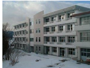
花北商業高等学校 (現 花巻青雲高等学校) 産業教育施設