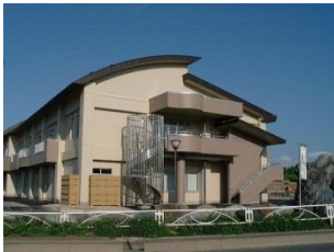
特別養護老人ホーム 花巻あすかの里