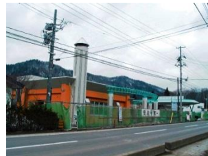
特別養護老人ホーム 大谷荘