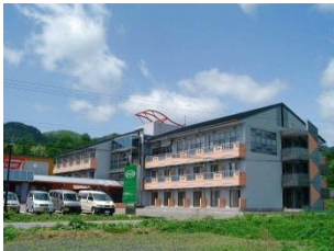
ケアハウス花巻 湯本デイサービスセンター