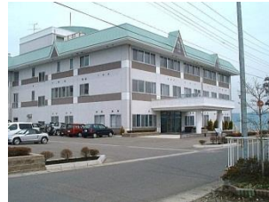
老人保健施設 サンシャイン