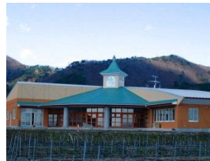
知的障害者通所更生施設 わたぼうし