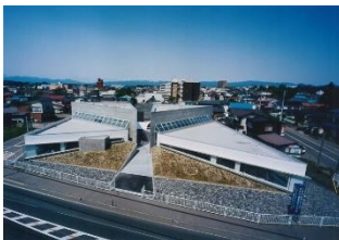
さとう内科・整形外科 クリニック