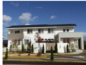
さやかクリニック (北上市景観賞受賞) 2013年3月完成 木造2階建 延床面積 275.55 m 2