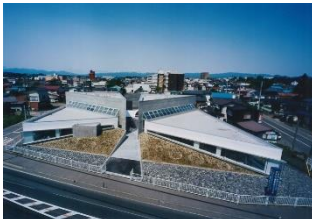
さとう内科・整形外科 クリニック