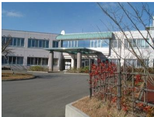
岩手県立東和病院