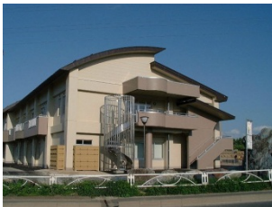
特別養護老人ホーム 花巻あすかの里