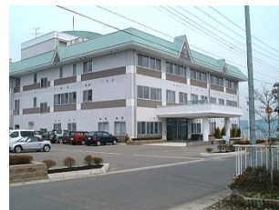
老人保健施設 サンシャイン