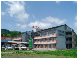
ケアハウス花巻 湯本デイサービスセンター