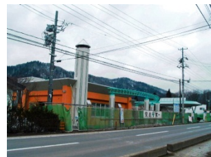
特別養護老人ホーム 大谷荘