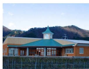
知的障害者通所更生施設 わたぼうし