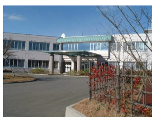
岩手県立東和病院